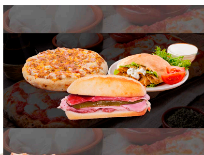
Pizzería y bocatería