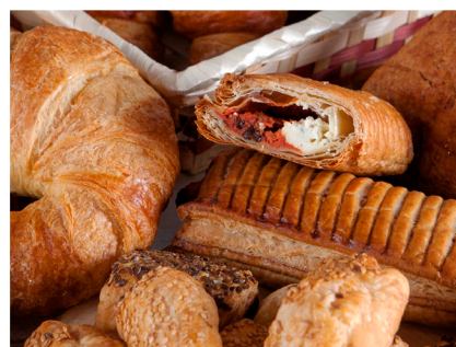
Bollería para hornear