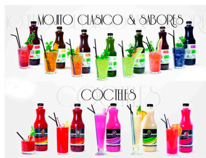
Mojitos y coctelería