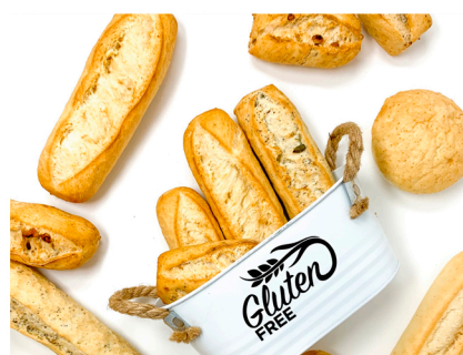
Productos Sin Gluten