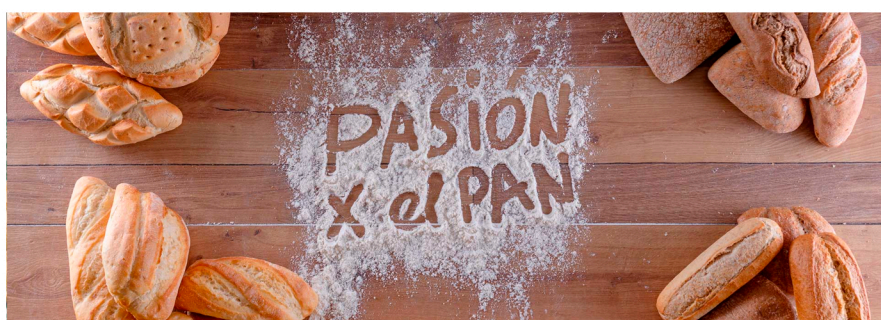
Gran variedad de pan precocido

Contamos con el apoyo y el respaldo de diferentes marcas con un gran prestigio a nivel nacional e internacional.